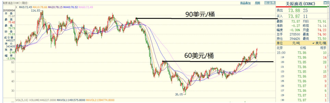
图 2：美原油主力连续周线图

如图 2 美原油主力连续周线图所示，目前原油价格已突破 2015 年 5 月 60 美元/桶前高价格，中美贸易战在是中国成为进口原油大国同时美国原油进入国际市场的关口利益争夺白热化的表现，油价成为美国的“工具”不难理解，油价在国际供给能力强大的情况下却不能如期下降反而上涨，什么价格出现都成为可能。